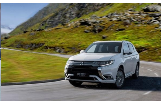
new Outlander PHEV