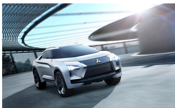
MITSUBISHI e-EVOLUTION CONCEPT

Le nouvel Outlander PHEV tout comme le MITSUBISHI e-EVOLUTION CONCEPT incarnent par leur sophistication technologique et l'expressivité de leur design les principales qualités que MMC entend conférer à ses modèles actuels et futurs. En outre, ils reflètent, chacun à leur façon, la stratégie produit de MMC qui s'inscrit dans le cadre des ambitions de la marque : réussir le subtil mélange entre expertise dans le domaine des SUV et technologies d'électro-mobilité, tout en y associant des technologies d'intégration systèmes de pointe pour une expérience de conduite inédite.